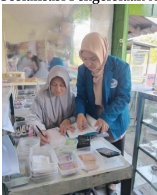
Gambar 3. Dokumentasi Pendampingan Penyusunan Buku Kas

Hasil evaluasi menunjukkan bahwa kegiatan pengabdian meningkatkan pemahaman dan keterampilan pengelolaan keuangan pemilik usaha. Pemilik bisnis sekarang dapat mencatat uang masuk dan keluar secara lebih teratur, membuat laporan arus kas sederhana, mencatat