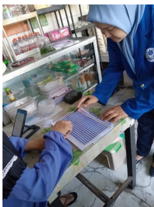
Gambar 2. Dokumentasi Sosialisasi Pengelolaan Arus Kas dan Modal Usaha

Kegiatan sosialisasi diberikan tentang manajemen arus kas, pencatatan modal usaha, dan pentingnya membedakan keuangan pribadi dan bisnis. Gambar 2 menunjukkan dokumentasi kegiatan sosialisasi.